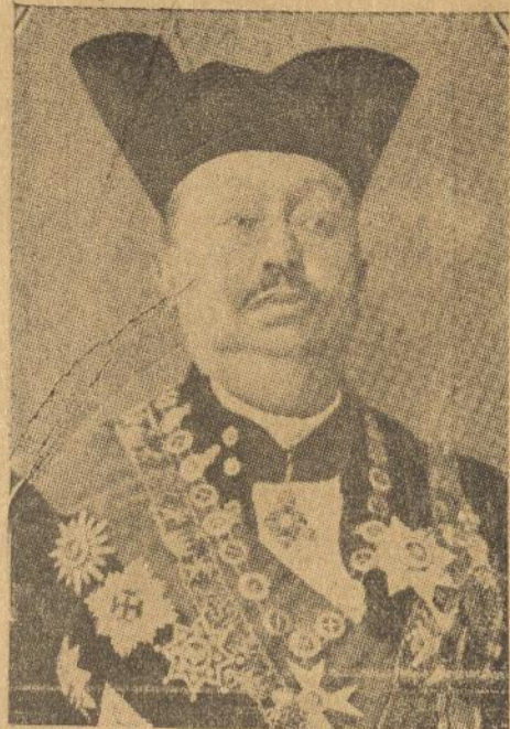
Z.V.H. Soesoehoenan Pakoe Boewono IX wafat dalam oesia 72 taheon dan memerintah keradjaan Soerakarta Adiningrat 46 taheon